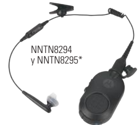
NNTN8294 y NNTN8295*

Audio Bluetooth 2.1 integrado al radio; permite un emparejamiento rápido y seguro con una amplia gama de accesorios Bluetooth. Fáciles de acoplar y conectar, los accesorios Bluetooth de Motorola optimizan su desempeño y seguridad dondequiera que trabaje. Los oficiales pueden hablar discretamente y en secreto, pueden moverse libremente sin cables y usar sus radios como nunca antes.