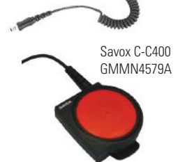
Savox C-C400 GMMN4579A

Complete la solución con la unidad Savox C-C400 com-control que posibilita el uso de su radio de dos vías en condiciones peligrosas. Especialmente diseñado para un máximo nivel de robustez para los entornos más hostiles, el botón PTT extragrande garantiza una transmisión exitosa incluso cuando se usa debajo de equipos especiales o ropa de protección.