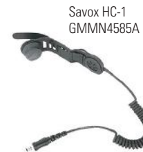
Savox HC-1 GMMN4585A

El Savox HC-1 es una unidad de "casco-com" para profesionales que trabajan en condiciones peligrosas. Puede acoplarse fácilmente a la mayoría de los cascos y ofrece una comunicación clara y manos libres, lo que lo convierte en el dispositivo ideal para bomberos y personal de rescate.